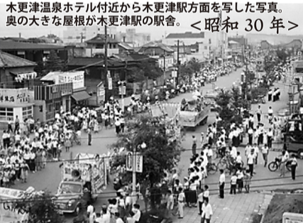
木更津温泉ホテル付近から木更津駅方面を写した写真。奥の大きな屋根が木更津駅の駅舎。<昭和30年>

▲「おにしま洋装店」「早川理髪店」「ジューキミシン」が目立つが、現在では「宝家」の駐車場となっている。