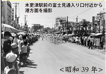
木更津駅前の富士見通り入り口付近から港方面を撮影